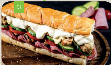
GIGANT Mini 8,40 Normal 12,70

Schinken 2,6 doppelt belegt, Salami 2,3,6,J doppelt belegt, Salatgurke, frische Tomaten, Frikadelle C,1,J , Champignons und Goudakäse 6 doppelt belegt