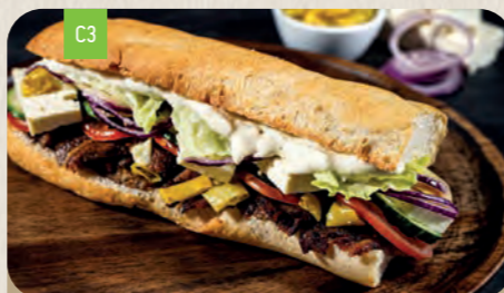
GYROS HELLAS Mini 8,40 Normal 12,90

Hähnchenbruststreifen, knuspriger Bacon 2 , feurige Jalapeños 6,18 und Rucolasalat