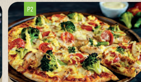
AMSTERDAM Medium 12,10 Large 14,50

Barbecuesauce 1J,20 , Rinderhackfleisch A,6,12,6 , rote Zwiebelringe, Peperonisalami 2,3,J und knuspriger Bacon 2