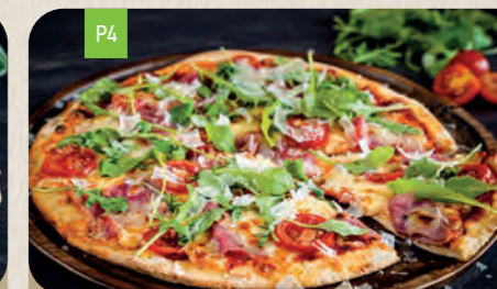
RUCOLA Medium 12,10 Large 14,50

Mozzarella 6 , Cherrytomaten und Basilikum