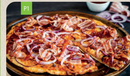
WESTERN BBQ Medium 12,70 Large 14,80

Barbecuesauce 1J,20 , Rinderhackfleisch A,6,12,6 , rote Zwiebelringe, Peperonisalami 2,3,J und knuspriger Bacon 2