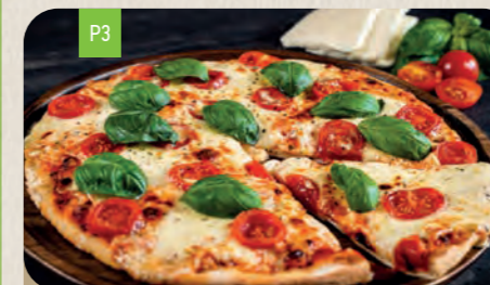
MARGHERITA Medium 10,70 Large 12,80

Hähnchenbruststreifen, Brokkoli, Cherrytomaten und Sauce Hollandaise C,6,J