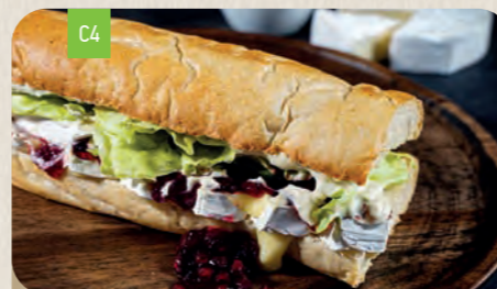
CAMEMBERT Mini 7,20 Normal 11,10

Hausgemachter Gyros 17 vom Spieß, Hirtenkäse 6 , Salatgurke, frische Tomaten, milde Peperoni 17,18 und rote Zwiebelringe