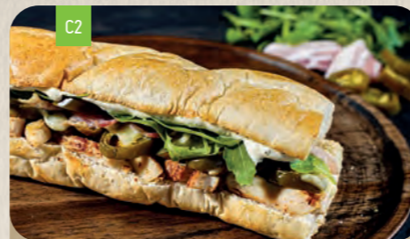
LOUISIANA Mini 7,80 Normal 11,90

Schinken 2,6 doppelt belegt, Salami 2,3,6,J doppelt belegt, Salatgurke, frische Tomaten, Frikadelle C,1,J , Champignons und Goudakäse 6 doppelt belegt